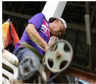
ผู้เข้าร่วมโครงการแยกดอกหญ้าของแต่ละคน และนำมานวดเพื่อเตรียมพร้อมสำหรับการถักไม้กวาดดอกหญ้า