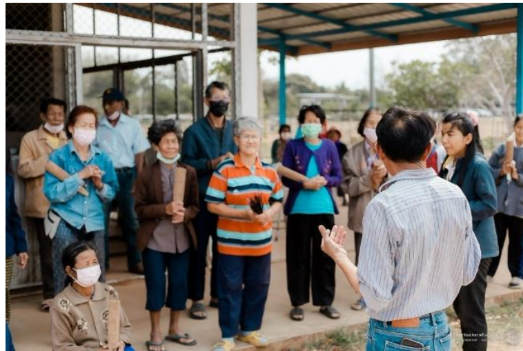
วิทยากรทั้ง 3 ท่าน บรรยายสรุปการทำผลิตภัณฑ์รักษ์โลกและรูปสมุนไพรรไล่องุ่น พร้อมตอบข้อคำถามแก่ผู้เข้าร่วมโครงการ และให้คำแนะนำและการพัฒนาต่อยอดกลุ่มผลิตภัณฑ์สมุนไพรต่างออกไป