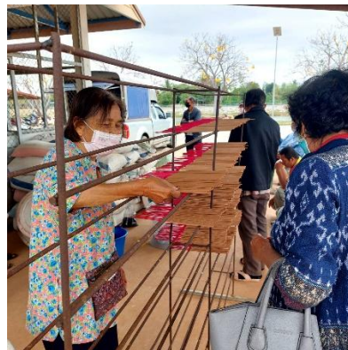
ผู้เข้าร่วมโครงการได้ฝึกปฏิบัติและเรียนรู้เทคนิคการตากรูปให้แห้ง