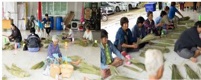
ผู้เข้าร่วมโครงการฝึกปฏิบัติการเตรียมดอกหญ้า เพื่อแยกยอดและก้าน