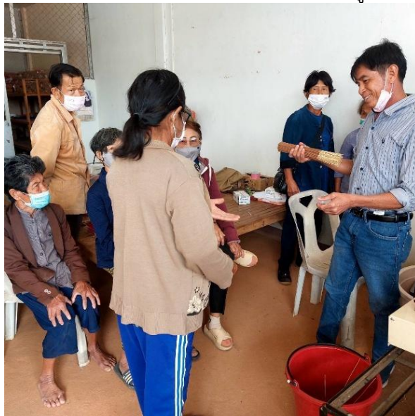
วิทยากรสาธิตการนำธูปจากเครื่องยิงธูปไปตากให้แห้งโดยใช้มือ