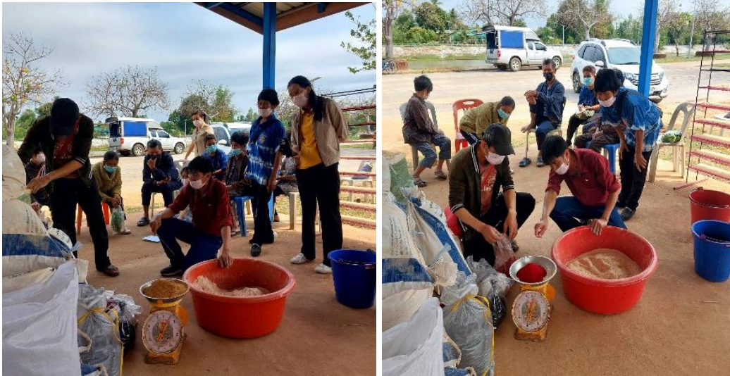
วิทยากรบรรยายให้ความรู้ เรื่อง ส่วนผสมการผลิตอุปสมุนไพรไฉ่ยง และเทคนิคการทำให้รูปมีความสวยงามและไม่แตกหัก