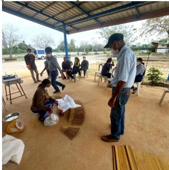
ผู้เข้าร่วมโครงการฝึกปฏิบัติการอบน้ำหอม ณ โรงผลิตรูปพญาเต่างอย