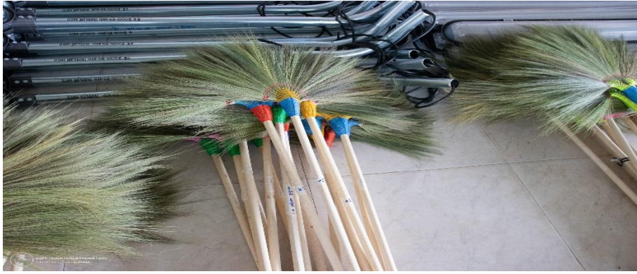
วิทยากรบรรยายการมัดรวมไม้กวาด 10 ด้าม เพื่อจัดหน่วยต่อไป