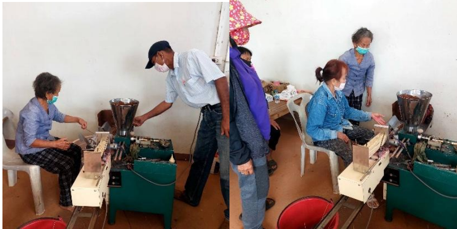
ผู้เข้าร่วมโครงการได้ฝึกปฏิบัติยิงธูปโดยใช้เครื่องยิงธูป และการแก้ไขปัญหาคณิตที่เครื่องยิงธูปเกิดปัญหาขัดข้อง และการปรับขนาดการวางหัวยิงธูป