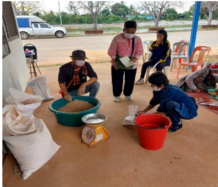
ผู้เข้าร่วมโครงการฝึกปฏิบัติการผสมส่วนผสมการทำรูปด้วยตนเอง โดยมีวิทยากรให้คำแนะนำและอธิบายขั้นตอนการผสมส่วนและสี