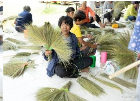
ผู้เข้าร่วมโครงการแต่ละคน ฝึกการเย็บไม้กวาดดอกหญ้าแต่ละชิ้นส่วนและนำมาประกอบกันเป็นชิ้น