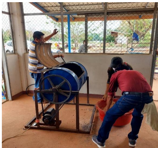
วิทยากรอธิบายขั้นตอนการปั่นส่วนผสมของรูปเข้าด้วยกัน โดยใช้เครื่องผสมรูป