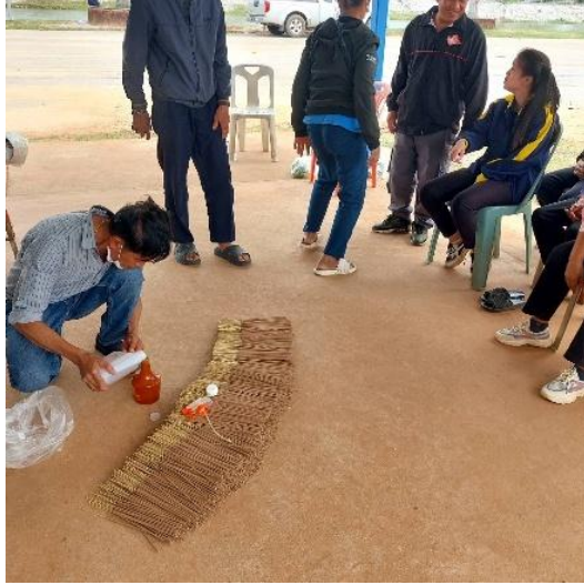
วิทยากรบรรยายให้ความรู้การอบน้ำหอมสำหรับรูปไข่กลั่นติดคงทน