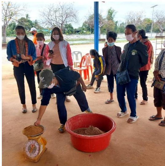
ผู้เข้าร่วมโครงการแต่ละคน ได้ฝึกปฏิบัติการทำอุปสมุนไพรไฉ่ยง โดยมีวิทยากรให้คำแนะนำและเทคนิคการผสมส่วนผสมต่างๆ