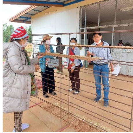
วิทยากรบรรยายให้ความรู้เทคนิคการวางรูปและการตากรูปโดยที่รูปไม่แตกหักและสวยงาม