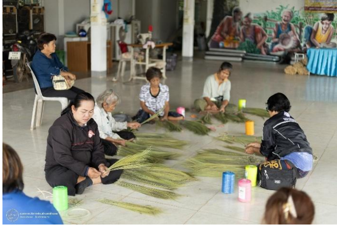
วิทยากรแบ่งกลุ่มผู้เข้าร่วมโครงการ เป็น 4 กลุ่มๆ ละ 7 คน โดยแจกอุปกรณ์การทำไม้กวาดดอกหญ้า โดยมีดอกหญ้า เชือกไนลอน เข็มให้แก่ผู้เข้าร่วมโครงการ จำนวน 30 คน