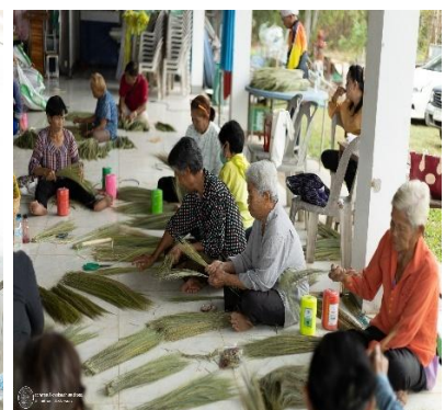
กิจกรรมที่ 2 เรื่อง การนวดหรืออบก้านหรือยอดที่ได้จากการแยกแล้วเพื่อสำหรับการถัก